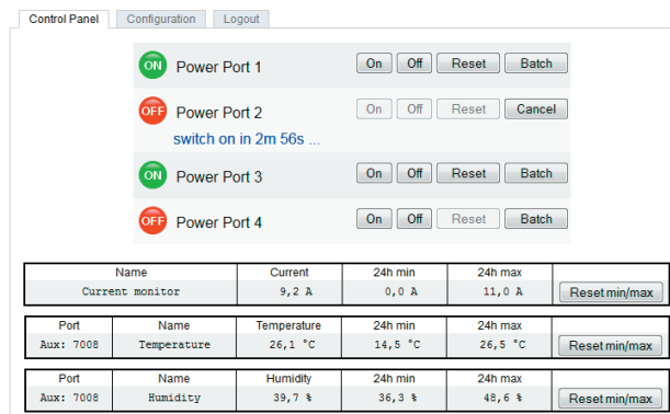
Abb. 1: Oberfläche des Webinterfaces

Das Webinterface ist die Bedienungszentrale Ihres Geräts (s. Abb. 1). Sie können es von jedem Rechner in Ihrem Netzwerk aus erreichen.